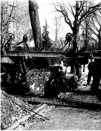
Fig. 1. Træflytning af Aeculus carnea , Kronprinsensvej. 1946. Frigravning af træet. Bemærk planteflytningevognen.