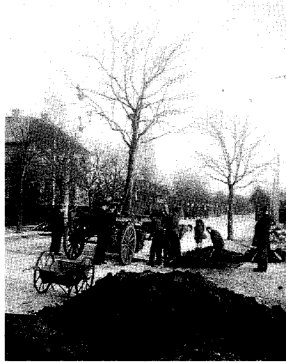
Fig. 2. Første træ er flyttet til vejsens sydside, det andet er på vej.