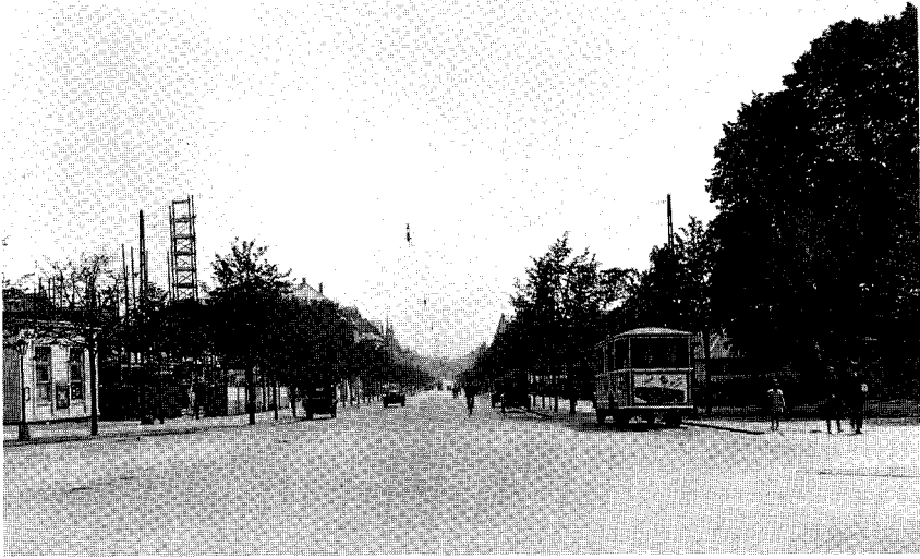
Fig. 3. Frederiksberg Allé set mod øst fra Frederiksberg Runddel, 1927. Træerne er plantet i 1926.

lempelig beskæring af træerne, men en sådan beskæring var i længden ikke tilstrækkelig. Man stod derfor overfor enten at skulle beskære langt kraftigere, med deraf følgende disharmoni mellem kronen og stammeomfanget eller vælge en bevidst formning af træerne. Træerne måtte gøres slanke og man sigtede efter kandelaberformen. Kandelaberbeskæringen foretoges ad flere gange. I marts 1952 blev rækkerne ind mod bebyggelsen beskåret. I marts 1956 behandlede hvert andet træ i rækkerne ind mod kørebanen og i marts 1958 blev den sidste fjerdedel beskåret. Denne rytme blev valgt, fordi man på denne måde kunne skjule den grove beskæring bag træernes nye tilvækst.