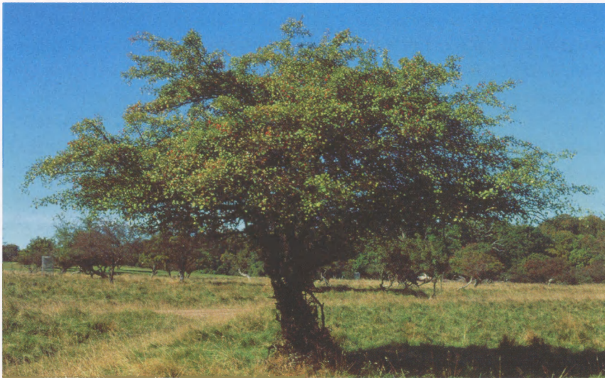
Figur 3. Koral-Hvidtjørn ( Crataegus rhipidophylla ). Vækstform. Eremitagesletten, Jægersborg Dyrehave. – Crataegus rhipidophylla . Growth form. Eremitagesletten, Jægersborg Dyrehave.