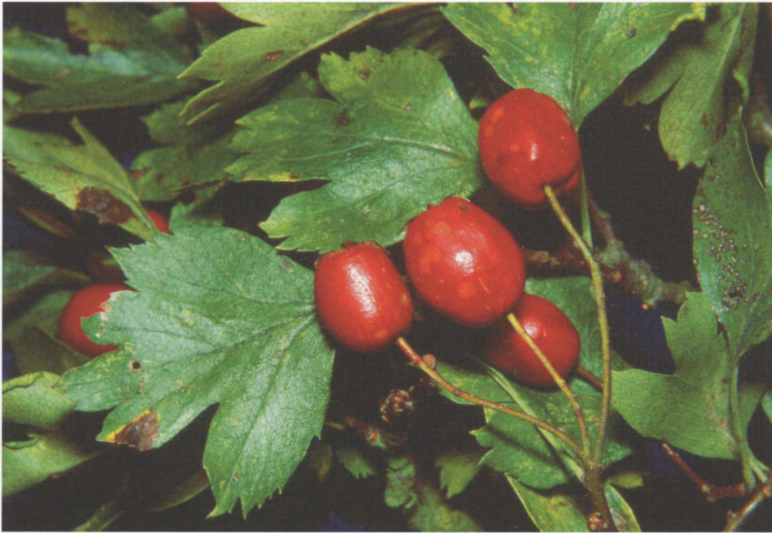
Figur 2. Koral-Hvidtjørn ( Crataegus rhipidophylla ). Blade og frugtstand. Eremitagesletten, Jægersborg Dyrehave. – Crataegus rhipidophylla . Leaves and infructescence. Eremitagesletten, Jægersborg Dyrehave.