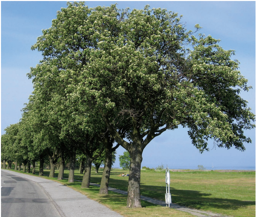
Figur 6. Seljerøn som vejtræ langs Stenbrudsvej ved østkysten nord for Nexø. Foto: Flemming Rune, 30. maj 2004.

Med en passende opkvistning og tynningshugst vil man uden tvivl kunne producere kvalitetstræ på stammer af kævle-