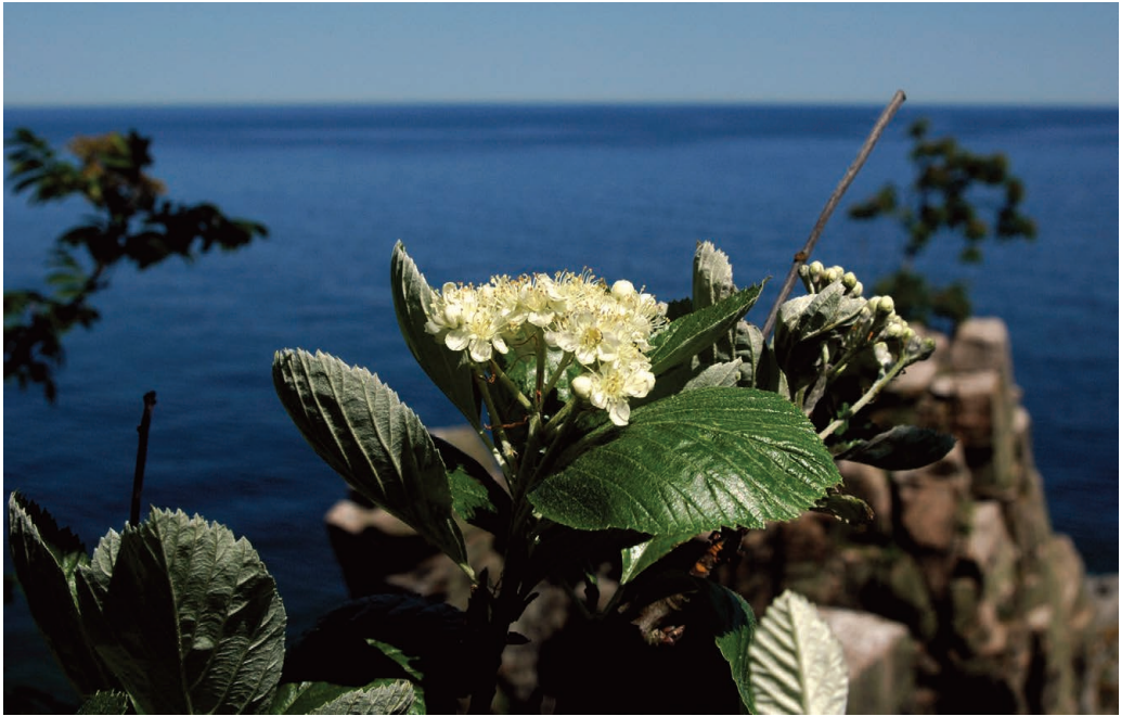
Figur 5. Blomstrende klipperøn på Libertsklippen ved Helligdommen på Bornholms nordkyst. De opretstående blade og bulen i bladets midte er typisk for klipperøn. Bulen skyldes, at bladranden holder op med at vokse tidligere end bladets indre dele. Foto: Finn Hansen, 9. juni 2007.

Klipperøn findes nogle få steder som indblanding i lysåbne skovtyper, blandt andet i Norge og England. På Bornholm er den udelukkende en udkantsart på skrænter og klippepartier, som er uinteressante til vedproduktion (figur 5).