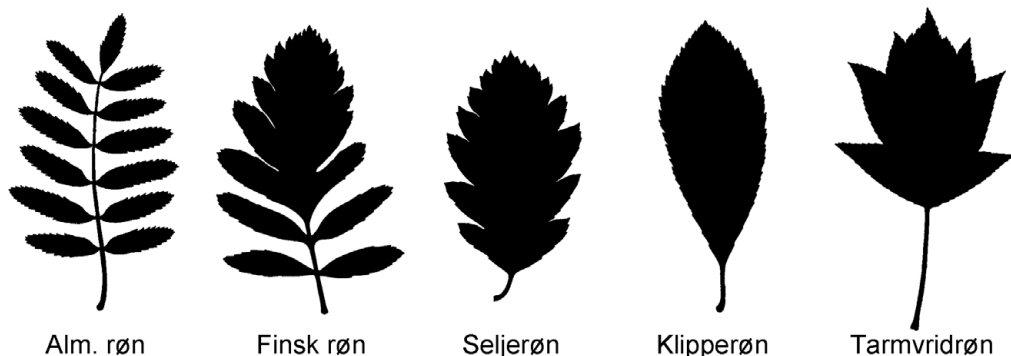
Figur 1. Bladsilhuetter af de fem rønnearter på Bornholm.

Røn er generelt lystrearter og trives derfor bedst i det åbne land, skovkanter og lysåbne skovtyper. De er samtidig, hvad man kan kalde klimarobuste, og tåler tørke, frost og andre klimaekstremer. Røn har en række pioneregenskaber, men