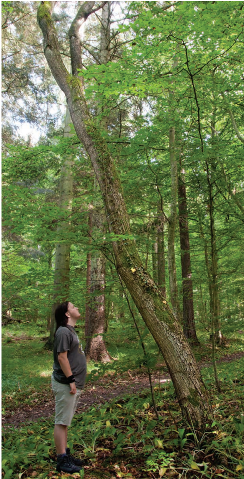
Figur 4. Tarmvridrøn i skoven i Døndalen. Stammediameter i brysthøjde (1,30 m over jorden) = 36 cm, kævlens længde (op til tvegen) = 6,5 m, træets højde = ca. 16 m. Tyske undersøgelser har vist, at det aldrig er for sent at hugge for en tarmvridrøn. Selv gamle træer reagerer på hugst, men en skæv stamme retter sig selvfølgelig ikke. I dette tilfælde har træet søgt efter lys ud mod skovstien, fordi det gennem lang tid er blevet forsømt med hugst. Foto: 8. juli 2012.

afkom af 'gode' træer i Ulvshale Skov på Møn eller fra et af artens optimumområder i Tyskland eller Frankrig.