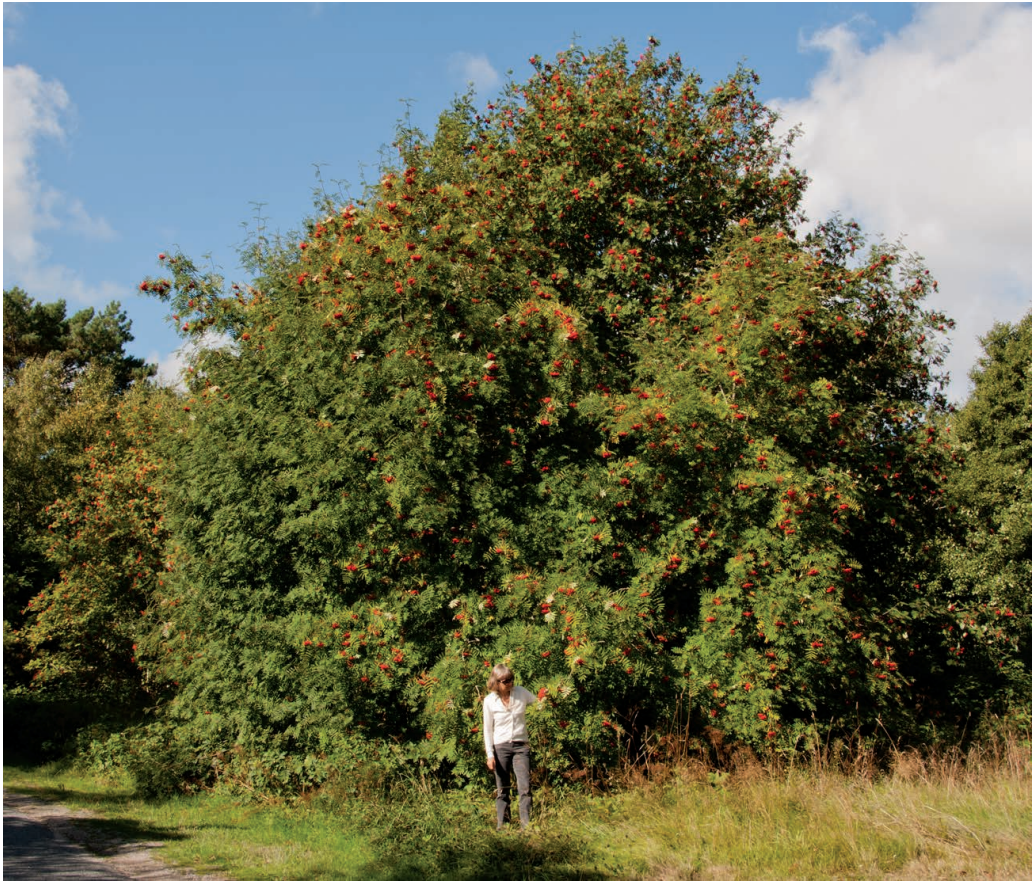
Figur 8. Almindelig røn bidrager markant til landskabets æstetiske kvaliteter, her med flot røde frugter. Foto: 15. august 2013.

På Bornholm findes almindelig røn, finsk røn, seljerøn, klipperøn og tarmvridrøn nogle steder i samme område og inden for kort afstand. Det gælder for eksempel på Helligdomsklipperne vest for Gudhjem (figur 9). Her er artsdannelsen inden for slægten Sorbus formodentlig fortsat aktiv. Fremmede rønarter, som er plantet eller forvildet, bidrager naturligvis også til denne proces.