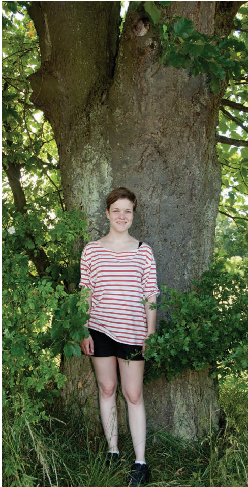
Figur 7. Seljerøn i læhegn nord for Bornholms Kunstmuseum på vej ned til Helligdomsklipperne. Træet er formodentlig omkring 100 år, og stammen har en diameter i brysthøjde på 90 cm. Foto: 8. juli 2012.

dimension i løbet af en rimelig årrække. Seljerøn burde derfor afprøves som skovtræ.