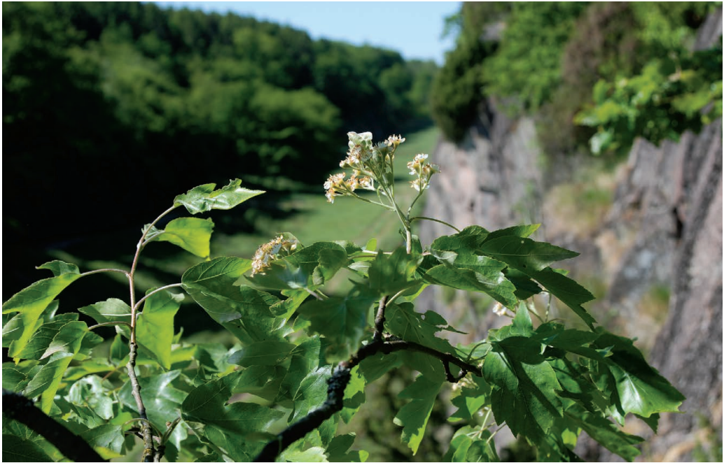
Figur 3. Blomstrende tarmvridrøn i Ekkodalen. 1. juni 2008.

efterstræbes stærkt af græssende husdyr, hårvildt og mus. Pleje i form af græsning er derfor uhensigtsmæssig.