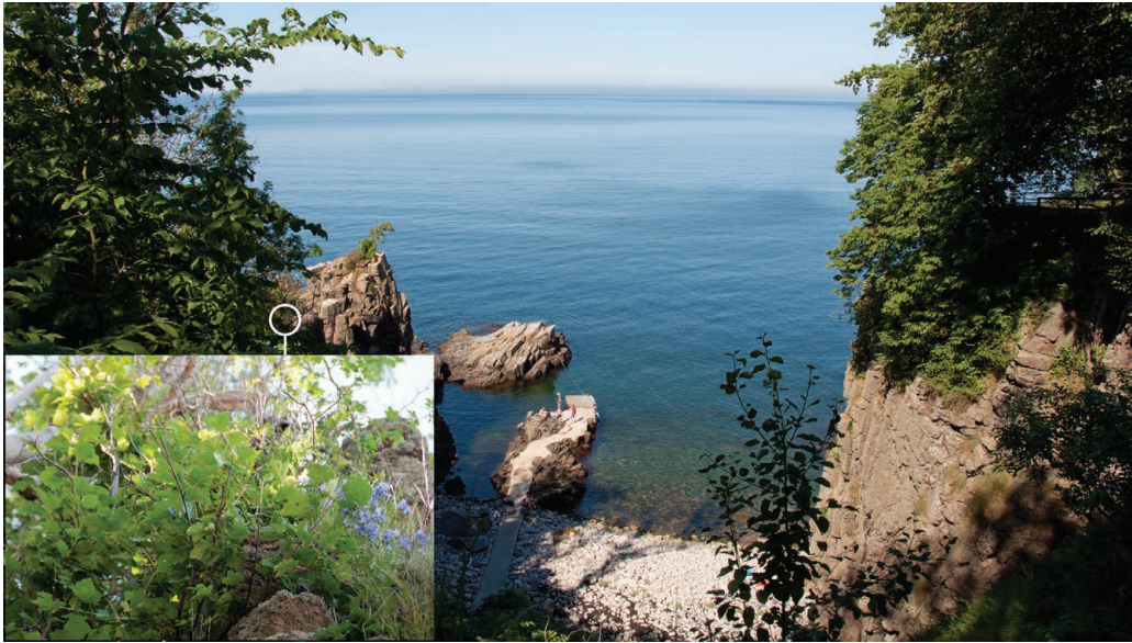
Figur 9. Røn på Libertsklippen vest for Gudhjem. Man skal have øjnene godt med sig for at identificere de enkelte arter. Markeringen med det indsatte billede viser en tarmvridrøn. Lige nord for træet (eller træerne?) står der en lidt større klipperøn og mod vest en endnu større almindelig røn. På Capri-klippen overfor (til højre i billedet) er der nogle store seljerøn. Seljerøn formodes oprindeligt at være opstået som en krydsning mellem de tre øvrige arter. Måske foregår der stadig hybridisering og lokal artsdannelse inden for slægten Sorbus på Bornholm. Foto: 8. juli 2012.

bar biologisk forbindelse i form af sammenhængende naturområder, økologiske ledelinjer eller dyr. Hertil kommer, at kendskabet til den enkelte arts økologi er begrænset.